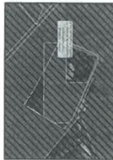
σε 1:100000 (Αρ. 28) με Δασικό Σχεδιασμό (ΔΣ) που διαγράφει όλο το γήρμα