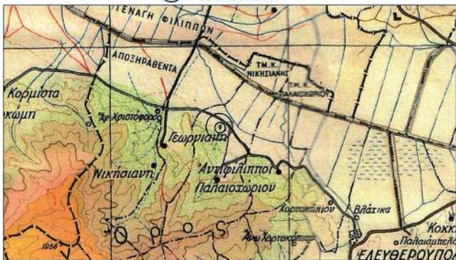
ΧΑΡΤΗΣ ΠΡΟΣΑΝΑΤΟΛΙΣΜΟΥ ΚΛΙΜΑΚΑ 1:200000 Θέση επίμβασης

Το παρόν αποτελεί αναπόσπαστο μέρος της υπ' αριθ. 536056/31.10.2024 απόφασης του Γενικού Γραμματέα Δασών Υ.Π.ΕΝ..