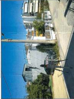
ΦΩΤΟΓΡΑΦΙΑ ΑΠΟ ΒΕΣΗ ΛΗΨΗΣ 2