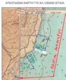
ΣΥΝΤΕΤΑΓΜΕΝΕΣ ΟΡΙΟΓΡΑΜΜΗΣ ΑΙΓΙΑΛΟΥ ΣΕ ΕΓΣΑ 87