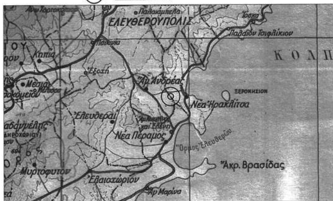
ΧΑΡΤΗΣ ΠΡΟΣΑΝΑΤΟΛΙΣΜΟΥ ΚΛΙΜΑΚΑ 1:200000 Θέση επίμβασης

Το παρόν αποτελεί αναπόσπαστο μέρος της υπ' αριθ. 676300/21-11-2023 απόφασης του Γενικού Γραμματέα Δασών Υ.Π.ΕΝ.