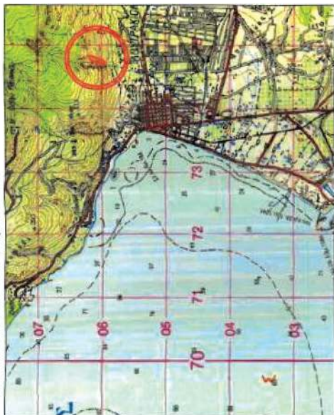
Φ.Χ. ΓΥΣ "ΚΟΡΙΝΘΟΣ", κλίμ. 1/50.000

ΕΘΝΙΚΟ ΤΥΠΟΓΡΑΦΕΙΟ Για τεχνικούς λόγους στο σχεδιάγραμμα, από το ηλεκτρονικό αρχείο, έγινε σμίκρυνση κατά ποσοστό 87%