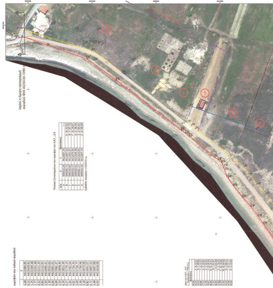
κορυφών του παλαιού αιτίλου