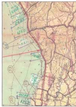
ΣΥΝΤΕΛΕΜΕΝΕΣ ΚΟΡΦΕΣ ΑΠΛΑΝΟΥ ΣΥΝΤΕΛΕΜΕΝΕΣ ΚΟΡΦΕΣ ΓΥΡΩΣΤΗΛΙΑΣ