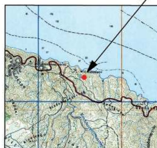
Αποτύπωση της έκτασης σε Απόσπασμα Φ.Χ. ΣΥΓΚΕΑ 1:50.000 Γ.Υ.Σ. L=40°15' / M=0°15'

Συστάδα 8α του Μοναστηριακού Δασοκτήματος "Κωνωπάδες", Ιεράς Μονής Ζωγράφου, Αγ. Όρους