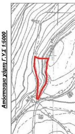
Απόσταση Χάρτη Γ.Υ.Σ 1:5000

“Εκτασης συνολικού εμβαδού 2.520,88 τμ με στοιχεία (1,2,.....19,20,1) στη θέση “ Δραγώλενα ” Τ.Κ Μπάλα, Δήμου Πατρέων που κήκε στις 23-8-2023 και κηρύσσεται αναδασωτέα.