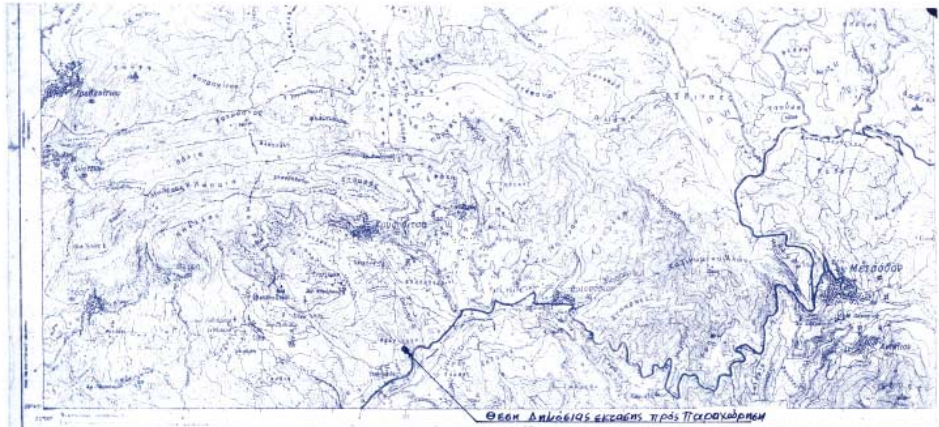
ΧΑΡΤΗΣ ΠΕΡΙΟΧΗΣ ΚΛ. 1:50000

Σύμφωνα με την περιγραφή Βεβαίωσης Β. ΖΑΓΟΡΕΥΩΝ Πλ. 2-9-79 (ΦΕΚ-615/Α-1-11-79) όπως τροποποιήθηκε με το ΠΔ-15-6-95 (ΦΕΚ-423/Α-20-6-95)