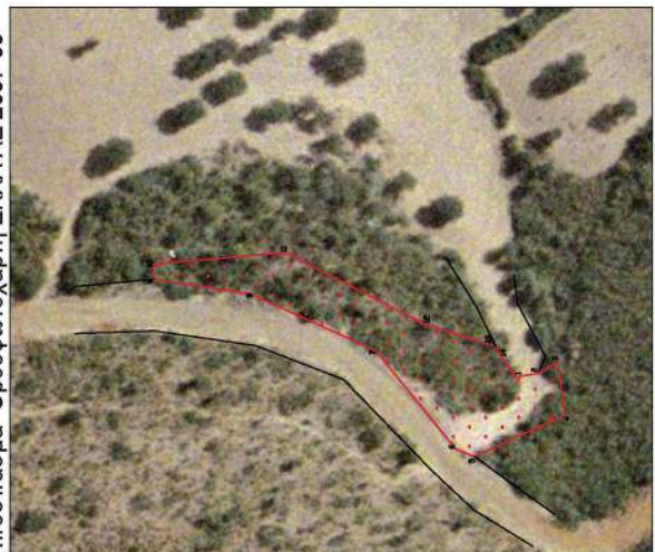
Απόσπασμα Ορθοφωτοχάρτη ΕΚΧΑ ΑΕ 2007-09