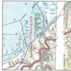
ΜΕΤΡΗΣΗ ΚΑΤΑ ΤΟ 1:50.000

ΕΘΝΙΚΟ ΤΥΠΟΓΡΑΦΕΙΟ Για τεχνικούς λόγους στο σχεδιάγραμμα, από το ηλεκτρονικό αρχείο, έγινε σμίκρυνση κατά ποσοστό 31%