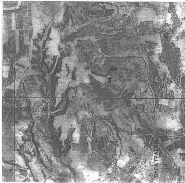
ΑΠΟΣΠΑΣΜΑ ΧΑΡΤΗ ΚΤΗΜΑΤΟΛΟΓΙΟΥ ΚΛΙΜΑΚΑΣ 1:30.000 ΘΕΣΗ ΚΑΜΕΝΗΣ ΕΚΤΑΣΗΣ

ΕΘΝΙΚΟ ΤΥΠΟΓΡΑΦΕΙΟ Για τεχνικούς λόγους στο σχεδιάγραμμα, από το ηλεκτρονικό αρχείο, έγινε σμίκρυνση κατά ποσοστό 81%