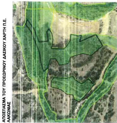
ΑΠΟΣΠΑΣΜΑ ΤΟΥ ΠΡΟΣΩΡΙΝΟΥ ΔΑΣΙΚΟΥ ΧΑΡΤΗ Π.Ε. ΛΑΚΩΝΙΑΣ

ΤΟΠΟΓΡΑΦΙΚΟ ΔΙΑΓΡΑΜΜΑ ΠΑΡΑΝΟΜΗΣ ΕΠΕΜΒΑΣΗΣ ΣΕ ΕΚΤΑΣΗ ΣΥΝΟΛΙΚΟΥ ΕΜΒΑΔΟΥ (Ε 1,2.....43,44,1+Ε 11,12.....122,123,11 = 7.889,31 τ.μ. +3.731,49 τ.μ.=) 11.620,80 τ.μ. ΥΠΑΓΟΜΕΝΗΣ ΣΤΙΣ ΔΙΑΤΑΞΕΙΣ ΤΗΣ ΔΑΣΙΚΗΣ ΝΟΜΟΘΕΣΙΑΣ (ένδειξη ΠΔ) ΣΥΜΦΩΝΑ ΜΕ ΤΟΝ ΠΡΟΣΩΡΙΝΟ ΔΑΣΙΚΟ ΧΑΡΤΗ Π.Ε. ΛΑΚΩΝΙΑΣ Ο ΟΠΟΙΟΣ ΘΕΩΡΗΘΗΚΕ ΜΕ ΤΗΝ ΥΠ' ΑΡΙΘΜ. 19437/27.01.2017 ΑΠΟΦΑΣΗ ΔΝΣΗΣ ΔΑΣΩΝ Π.Ε. ΛΑΚΩΝΙΑΣ ΣΤΗ ΘΕΣΗ "ΡΟΓΓΙΑ" Τ.Κ.ΒΡΟΝΤΑΜΑ ΔΗΜ. ΕΝΟΤΗΤΑΣ ΣΚΑΛΑΣ ΔΗΜΟΥ ΕΥΡΩΤΑ ΚΛΙΜΑΚΑ 1:2000, ΣΥΣΤΗΜΑ ΑΝΑΦΟΡΑΣ Ε.Γ.Σ.Α. '87