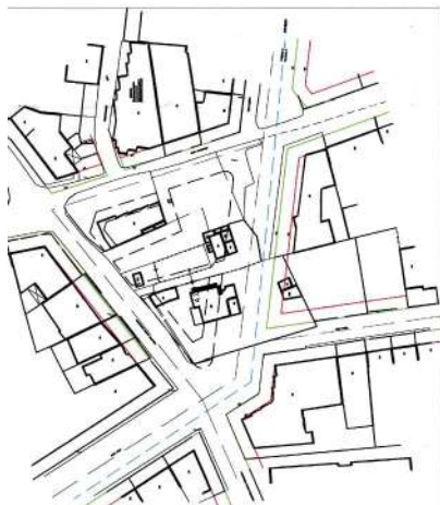
ΙΣΧΥΟΝ ΣΧΕΔΙΟ ΠΟΛΗΣ ΚΑΙΜΑΚΑ 1:1000