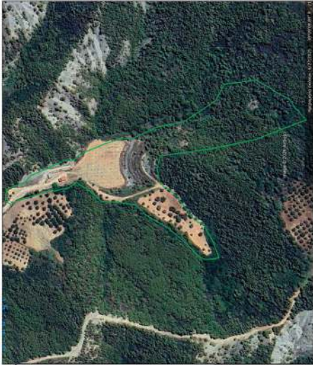
ΣΥΝΤΕΤΑΓΜΕΝΕΣ ΣΗΜΕΙΩΝ ΕΓΣΔΒΤ