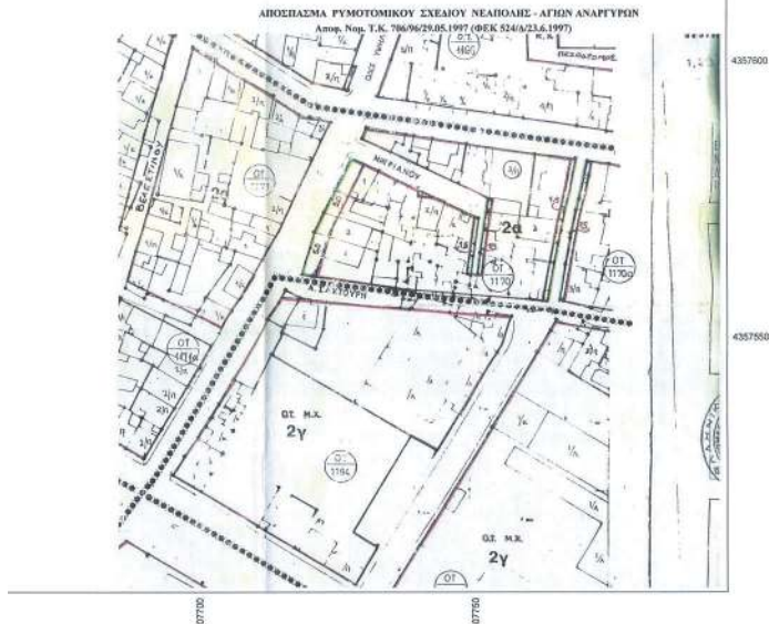
ΑΠΟΣΠΑΣΜΑ ΡΥΠΟΓΟΝΟΜΙΚΟΥ ΣΧΕΔΙΟΥ ΝΕΑΠΟΛΗΣ - ΑΓΙΩΝ ΑΝΑΓΥΡΩΝ