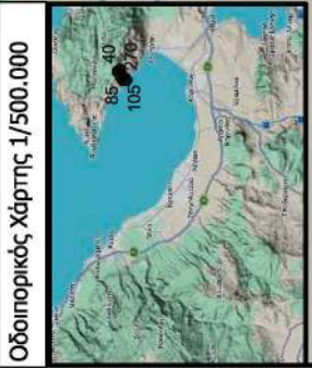
Οδοιπορικός Χάρτης 1/500.000

Τοπογραφικό Διάγραμμα Έκτασης στη θέση "Μπούτσι", Δ.Κ. Λουτρακίου-Περαχώρας, Δήμου Λουτρακίου-Περαχώρας, Αγίων Θεοδώρων, για το οποίο προτείνεται η μερική Ανάκληση λόγω πλάνης της αριθ. 1719/1986 Απόφασης Κήρυξης Αναδασωτέας Νομάρχη Κορινθίας. Κλίμ. 1/5.000