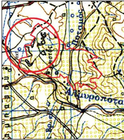
Χάρτης Προσανατολισμού Απόστασµα χάρτη 1:50.000 σε µεγέθυνση