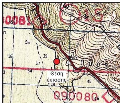
ΑΠΟΣΠΑΣΜΑ ΦΥΛΛΟΥ ΧΑΡΤΗ ΛΕΥΚΙΜΜΗΣ - ΚΛΙΜΑΚΑ 1:50000

ΕΘΝΙΚΟ ΤΥΠΟΓΡΑΦΕΙΟ Για τεχνικούς λόγους στο σχεδιάγραμμα, από το ηλεκτρονικό αρχείο, έγινε σμίκρυνση κατά ποσοστό 83%