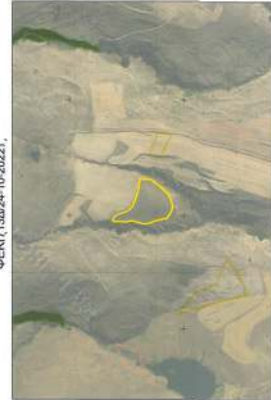
Απόσταση Μερικής Κυρωμένου Δασικού Χάρτη ΦΕΚ(7130/24-10-2022).

ΟΡΘΟ ΔΟΜΗΣΗΣ: Π.Δ. 24-05-85 (ΦΕΚ27/04, 31-05-85)αρθ.33 του Ν.4759/2020 (ΦΕΚ 245/Α/09-12-20) όπως τροποποιήθηκαν και ισχύουν.