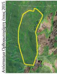
Απόσπασμα Ορθοφωτογράμμι έτους 2015

Καμένου δάσους της παρ. 1 του άρθρου 3 του Ν.998/79, όπως αντικαταστάθηκε από το άρθρο 1 του Ν. 3208/2003, συνολικού εμβαδού 96.256,49 τ.μ. στη δασική θέση «Άγιος Ιωάννης», Τ.Κ. Ποροβίτσας, Δ.Ε. Ακράτας του Δήμου Αιγιαλείας, με στοιχεία περιμέτρου (1,2,3,4,5,6,.....,27,28,29,30,1), η οποία κηρύσσεται αναδάσωτα.