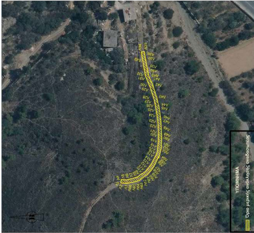
ΚΛΙΜΑΚΑ 1 : 1000

Μερική ανάκληση της υπ' αρ. 2056/18.09.1998 (ΦΕΚ 858/Δ/29-10-98) απόφασης του Νομάρχη Χίου περί κήρυξης αναδασωτέας, ως προς έκταση συνολικού εμβαδού 298,99 τ.μ. στη θέση «Λιβάδια» Δ.Ε. Χίου, Δήμου Χίου, Π.Ε. Χίου.