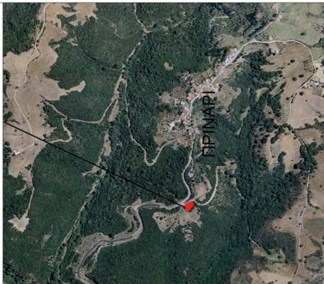
ΑΠΟΣΠΑΣΜΑ ΧΑΡΤΗ ΚΤΗΜΑΤΟΛΟΓΙΟΥ ΚΛΙΜΑΚΑΣ 1:10.000 ΘΕΣΗ ΕΚΤΑΣΗΣ

ΕΛΛΗΝΙΚΗ ΔΗΜΟΚΡΑΤΙΑ ΥΠΟΥΡΓΕΙΟ ΠΕΡΙΒΑΛΛΟΝΤΟΣ & ΕΝΕΡΓΕΙΑΣ ΕΠΙΘΕΩΡΗΣΗ ΕΦΑΡΜΟΓΗΣ ΔΑΣΙΚΗΣ ΠΟΛΙΤΙΚΗΣ ΠΕΛΟΠΟΝΝΗΣΟΥ, ΔΥΤΙΚΗΣ ΕΛΛΑΔΑΣ ΚΑΙ ΙΟΝΙΟΥ ΔΙΕΥΘΥΝΣΗ ΔΑΣΩΝ ΗΛΕΙΑΣ ΔΑΣΑΡΧΕΙΟ ΑΜΑΛΙΑΔΑΣ