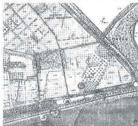
Απόσπασμα Διαγράμματος Γ.Π.Σ. Αλεξανδρούπολης.

ΕΘΝΙΚΟ ΤΥΠΟΓΡΑΦΕΙΟ Για τεχνικούς λόγους στο σχεδιάγραμμα, από το ηλεκτρονικό αρχείο, έγινε σμίκρυνση κατά ποσοστό 37%