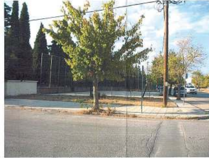
Νότιο Ανατολική πλευρά Ο.Τ. 469 Όριο Ιδιοκτησίας Παπαδοπούλου με Νεκροταφείο. Γωνία οδού Μακαρίου-Αγ. Ποιμενίδη

ΕΘΝΙΚΟ ΤΥΠΟΓΡΑΦΕΙΟ Για τεχνικούς λόγους στο σχεδιάγραμμα, από το ηλεκτρονικό αρχείο, έγινε σμίκρυνση κατά ποσοστό 37%