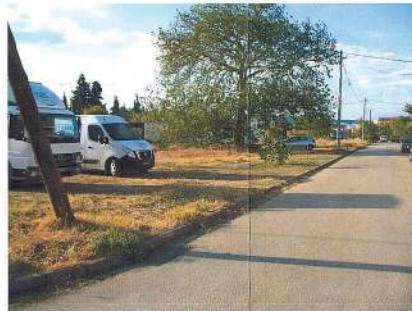
Ανατολική πλευρά Ο.Τ. 470 Ιδιοκτησία Παπαδοπούλου Γωνία οδού Μακαρίου και Δημοσθένη