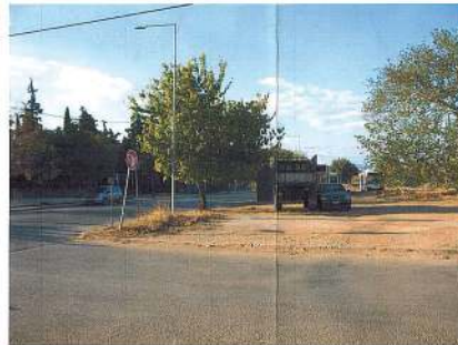
Νότιο-Δυτική πλευρά Ο.Τ. 470 Ιδιοκτησία Παπαδοπούλου Γωνία οδού Μακαρίου-Αγ. Ποιμενίδη