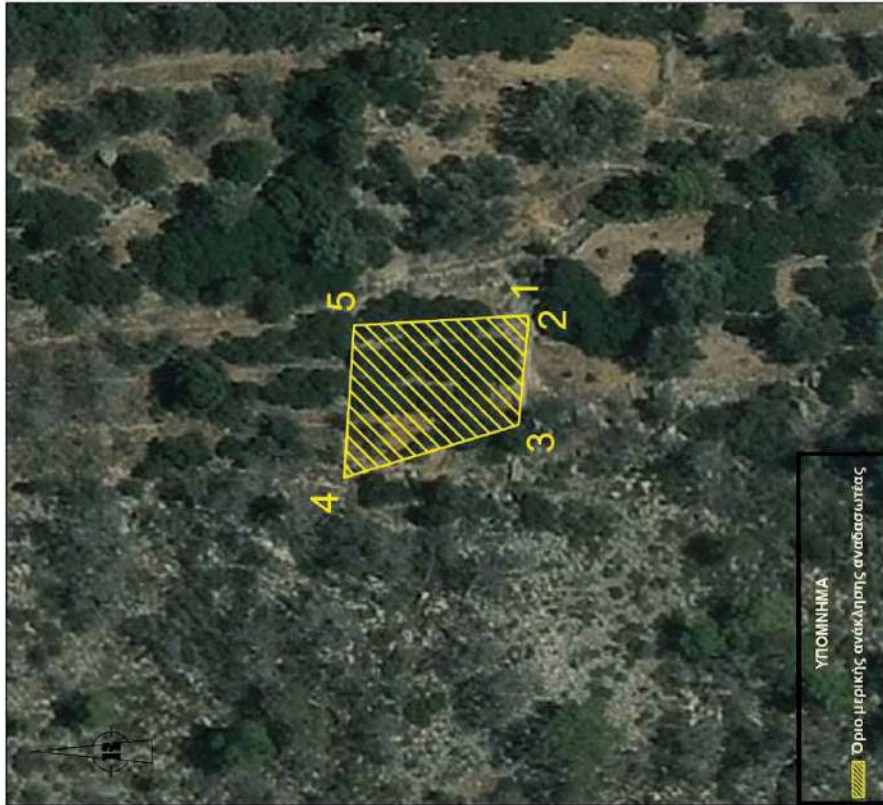
ΚΛΙΜΑΚΑ 1 : 500 Ανήκει αναπόσπαστα στην υπ' αρ. 155487/30-04-2026 απόφαση του Γενικού Γραμματέα Δασών του ΥΠΕΝ

Μερική ανάκληση της υπ' αρ. 46079/2369/2013 (Δ' 497) απόφασης της Γενικής Γραμματέα Αποκεντρωμένης Διοίκησης Αιγαίου περί κήρυξης αναδασωτέας, ως προς έκταση συνολικού εμβαδού 272,46 τ.μ. στη θέση «Πατέλα», Δ.Κ. Αρρολιών, Δ.Ε. Μαστιχοχωρίων, Δήμου Χίου, Π.Ε. Χίου