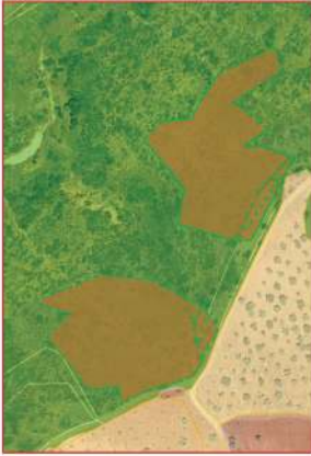
ΑΠΟΣΤΑΣΜΑ ΤΟΥ ΜΕΡΙΚΩΣ ΚΥΡΩΜΕΝΟΥ ΔΑΣΙΚΟΥ ΧΑΡΤΗ Π.Ε. ΛΑΚΩΝΙΑΣ

ΕΘΝΙΚΟ ΤΥΠΟΓΡΑΦΕΙΟ Για τεχνικούς λόγους στο σχεδιάγραμμα, από το ηλεκτρονικό αρχείο, έγινε αμίκρυνση κατά ποσοστό 81%