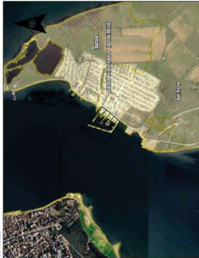
ΑΠΟΣΤΑΣΜΑ ΚΥΡΙΑΜΕΝΟΙ ΔΑΣΙΚΟΥ ΧΑΡΤΗ (ΦΕΚ 939/6/2022) κ.λ. 1:10000