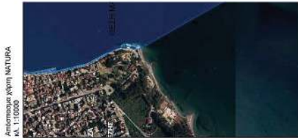
Αεροφωτογραφία κόπης ΝΑΦΛΙΑ κ.λ. 1:10000