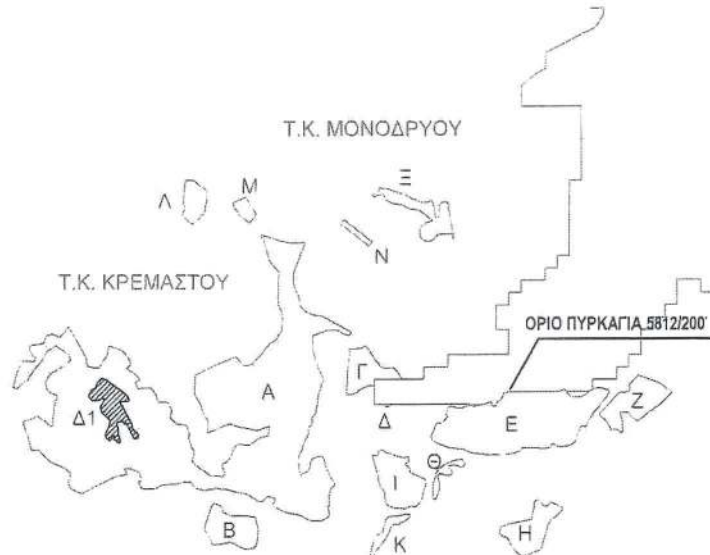
ΚΑΤΑΤΟΠΙΣΤΙΚΟΣ ΧΑΡΤΗΣ Γ.Υ.Σ (Φ.Χ. ΚΥΜΗ) ΚΛΙΜΑΚΑ 1:20.000

ΕΘΝΙΚΟ ΤΥΠΟΓΡΑΦΕΙΟ Για τεχνικούς λόγους στο σχεδιάγραμμα, από το ηλεκτρονικό αρχείο, έγινε σμίκρυνση κατά ποσοστό 82%