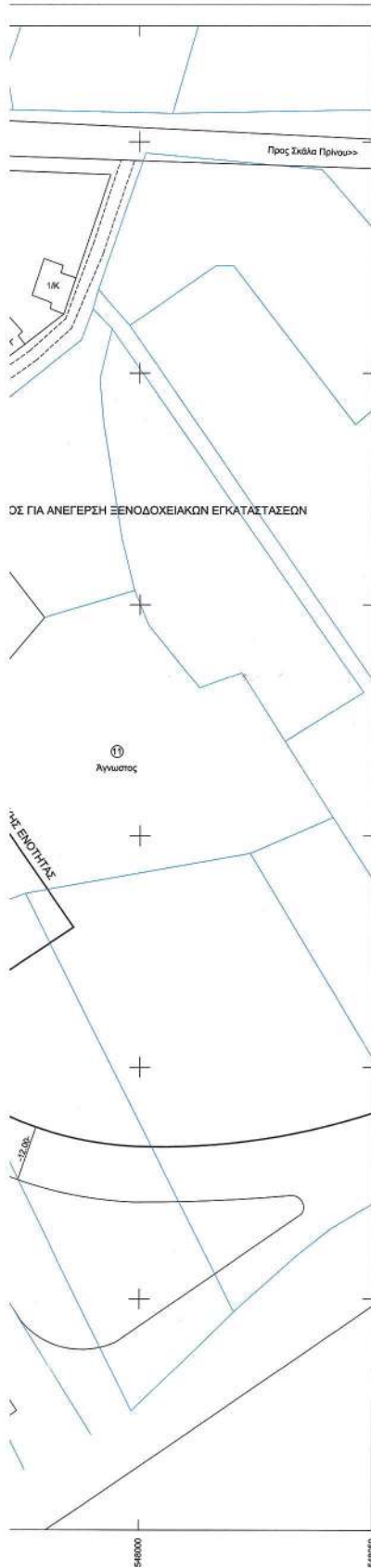
ΑΠΟΣΠΑΣΜΑ ΕΓΚΕΚΡΙΜΕΝΟΥ ΡΥΘΜΟΤΟΜΙΚΟΥ ΣΧΕΔΙΟΥ ΔΑΣΑΚΙ ΠΡΙΝΟΥ ΝΗΣΟΥ ΘΑΣΟΥ ΚΛΙΜΑΚΑ 1:2000