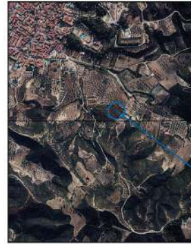
Έκταση προς άρση αναδασωθείας