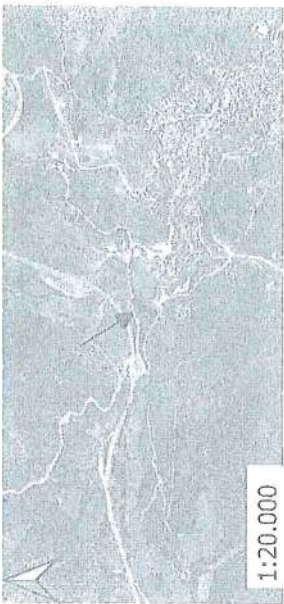
ΚΟΡΥΦΕΣ ΣΕ ΕΓΣΑ 87

ΕΘΝΙΚΟ ΤΥΠΟΓΡΑΦΕΙΟ Για τεχνικούς λόγους στο σχεδιάγραμμα, από το ηλεκτρονικό αρχείο, έγινε σμίκρυνση κατά ποσοστό 82%